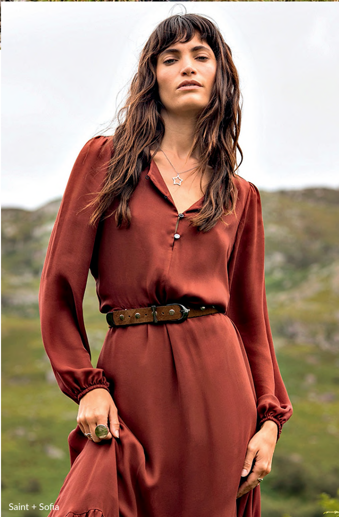
Saint + Sofia