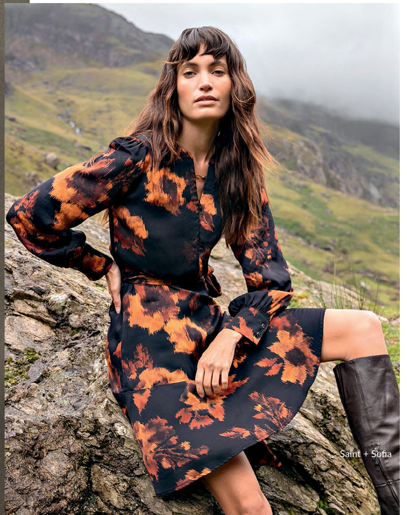
Saint + Sofia