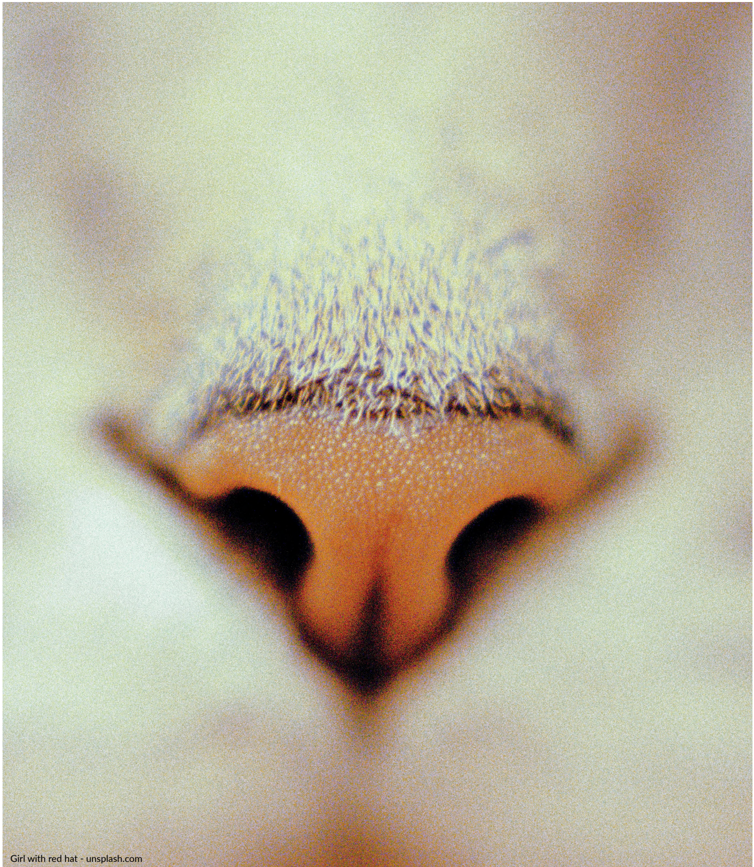
Girl with red hat

1. 2. 3. Lampo by Lanfranchi ribbons with GRS 6 certified yarns, galvanized with Oeko-Tex ® Standard 100 class 1 certification